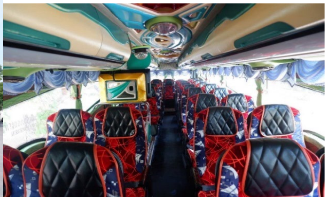
รถบัสวีไอพี 2 ชั้น อาจจะเป็นที่นั่งได้ ภาพนี้เป็นแค่ตัวอย่างเท่านั้น

11.00 น. เดินทางถึง จ.ตราด นำท่านไหว้กรมหลวงชุมพรที่ อนุสรณ์สถานยุทธนาวีที่เกาะช้าง ตั้งอยู่ที่ถนนสุขาภิบาล 3 ตำบล