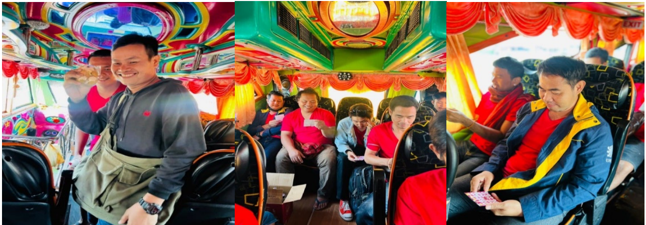
รถบัสวีไอพีปรับอากาศ

กิจกรรมบนรถบัส เล่นเกมชิงของรางวัล เช่นเกม ทายปัญหา เกมบิงโก เกมหัวใจ 6 ดวง หรืออื่นๆ