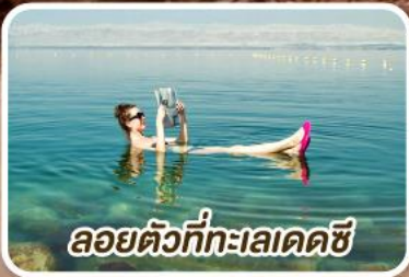
ลอยตัวที่ทะเลเดดซี