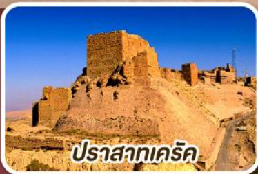
ปราสาทเคิร์ค