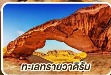
ทะเลทรายวาดีรัม