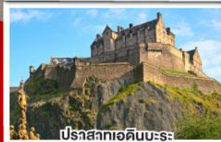
ปราสาทเอ็ดินเบอร์ก