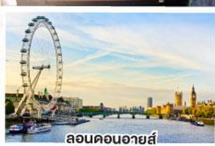
ลอนดอนอายส์