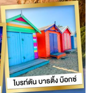
ไบรด์ตัน บาร์ตัง บ็อกซ์