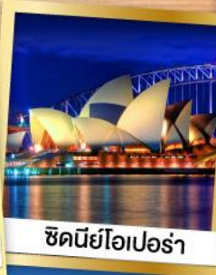
ซิดนีย์โอเปร่า